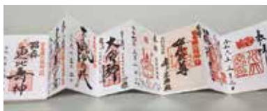
御朱印集めで運氣の上昇を祈願

で、コンテストの課題をとっても難しく感じましたが、無事入賞することができました。その副賞として頂いたのが、私にとっては初めてとなる日本への旅行でした。この旅行がきっかけとなり、卒業後2018年に再来日。現在は社会福祉法人池田さつき会本部にて、外国籍スタッフの仕事と生活面のサポートをしています。これからも池田さつき会の職員たちとともに成長していきたいと思っています。